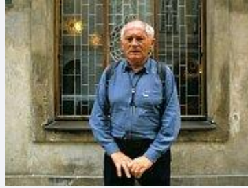
Bohumil Hrabal.

Na třídní akci s hutným názvem Hrabalova schizofrenická historiografie, Literatura Bohumila Hrabala v dějinných zlomech krátkého 20. století se sjedou specialisté z celého světa, kromě České republiky z Belgie, Francie, Itálie , Polska, Německa, Rakouska a USA. Většina z nich patří již k mladší generaci vědců, a proto můžeme očekávat čerstvý závan v pohledu na uctívaného autora.